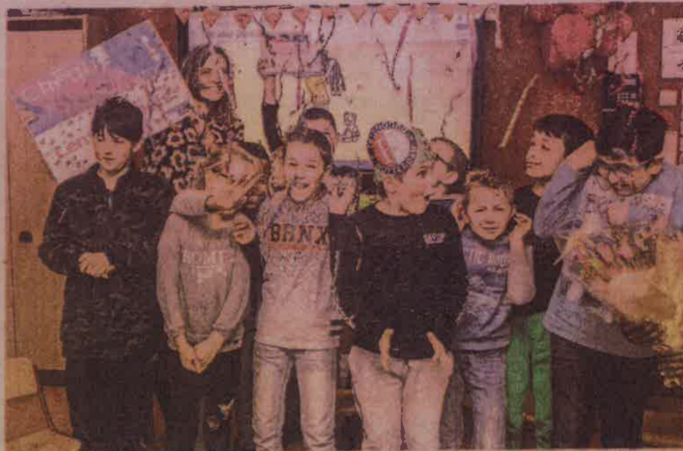
Ook de kinderen zijn trots dat hun school de Lentekriebels Award heeft gewonnen.